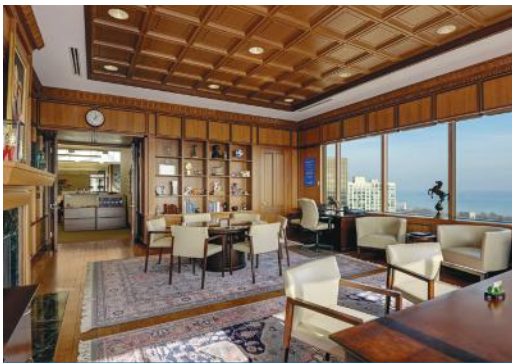
Zyra e presidentit Rotary International në katin e 18-të të One Rotary Center ka pamje nga liqeni Michigan.

One Rotary Center pret më shumë se 2000 Rotarianë dhe të ftuar çdo vit. Nga e hëna në të premte ofrohen turne falas me guidë në disa gjuhë. Dërgo email visitors@rotary.org për të kërkuar një turne.