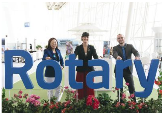
Pjesëmarrës në Konventën Ndërkombëtare Rotary 2016, Kore