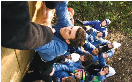
Ngjarjet e RYLA rrënjisin vlerat e shërbimit dhe udhëheqjes që në moshë të re.

Klubet Interact dhe Rotaract sponsorizohen nga klubet Rotariane aty pranë. Pyetni drejtuesit e klubit tuaj se si mund të përfshiheni nëse dëshironi të punoni me klubet lokale Interact dhe Rotaract.