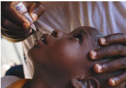
Rotariani administron vaksinën e poliomielitit në Nigeri, Afrikë

Kontributet e anëtarëve tanë dhe të tjerëve për Fondacionin na lejojnë të sjellim ndryshime të qëndrueshme për komunitetet në nevojë. Pyetni kryetarin e komitetit të Fondacionit Rotary të klubit tuaj ose vizitoni rotary.org/donate për të mësuar se si mund ta mbështesni Fondacionin tonë. Për të mësuar më shumë, shkarkoni Udhëzuesin e Referencës së Fondacionit Rotary ose ndiqni kursin Bazat e Fondacionit Rotary në Qendrën Mësimore të Rotary.