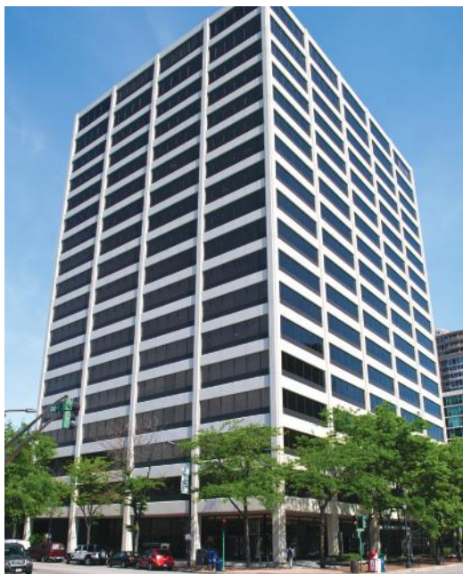
One Rotary Center në Evanston, Illinois, SHBA

Rotary International administrohet nga Sekretariati, i cili përbëhet nga Sekretari i Përgjithshëm dhe afro 800 punonjës që punojnë për të mbështetur klubet dhe distriktet anembanë botës. Selia botërore e Rotary është në Evanston, Illinois, SHBA, në një ndërtesë të quajtur One Rotary Center. Ajo përfshin një auditorium me 190 vende, arkivat e Rotarisë dhe një kompleks ekzekutiv me salla konferencash për Bordin e Drejtorëve të RI dhe Administratorët e Fondacionit Rotary dhe zyrat e presidenti i RI dhe oficerë të tjerë të lartë.